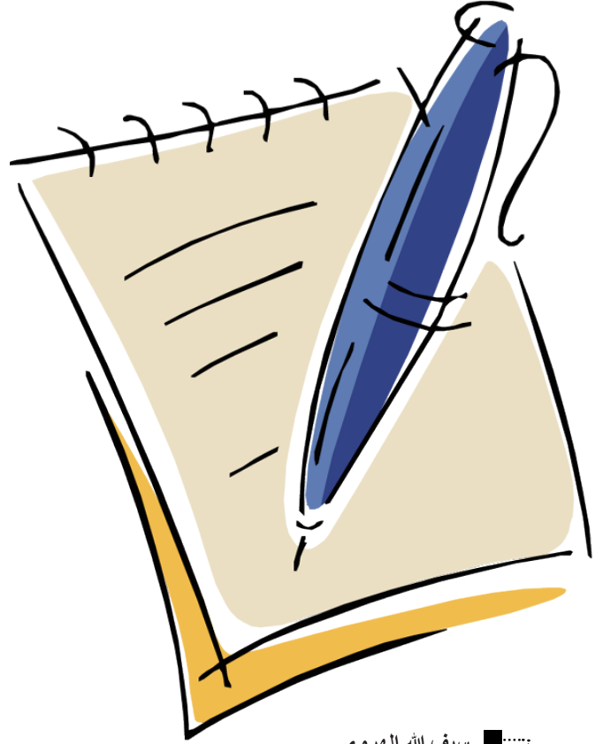
سيف الله الهروي

أبهر العالم والأمم، وتوقفت الحرب عسكرياً. لكن لا يخفى على أحد أن الحرب وإن توقفت عسكرياً، قد تركزت وازدادت في الميادين الأخرى التعليمية والاقتصادية والإعلامية.